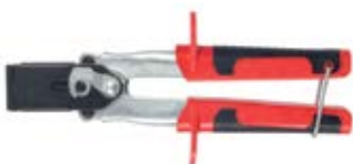
HM Z 1 – профессиональный монтажный инструмент