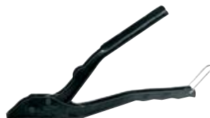
HM Z 2 – непрофессиональный монтажный инструмент