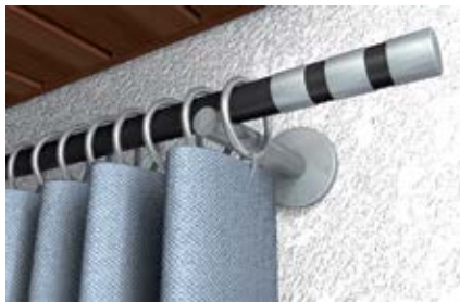
Карнизы для штор